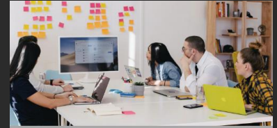
Πρόγραμμα Ενδοϋπηρεσιακής Κατάρτισης για Εκπαιδευτές Ανθρώπινου Δυναμικού σε μορφή Μαζικού Διαδικτυακού Ανοικτού Μαθήματος

Εγγραφείτε στα δύο Μαζικά Ανοικτά Διαδικτυακά Μαθήματα και εκπαιδευτείτε για να κάνετε την Πολυμορφία και τη Συμπεριληψη στο χώρο εργασίας τον κανόνα!